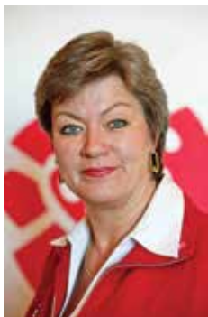
Ylva Johansson (S)

– Det är en spännande debatt som pågår. Jag har all respekt för dem som vill testa detta nya grepp. Jag följer dem som använder sig av metoden, och vi får hoppas att det kan vara ett nytt, fräscht grepp för att åstadkomma jämställdhet, säger hon.