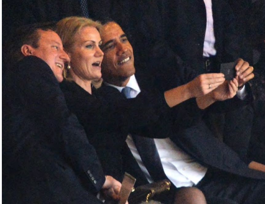
Danske toppolitikere satte sitt preg på språket i 2013. Statsminister Helle Thorning-Schmidt tok en «selfie» med David Cameron og Barack Obama, mens opposisjonsleder Lars Løkke Rasmussen måtte si «undskyld».

det ble fjernet snø fra busstraseer og skolegårder.