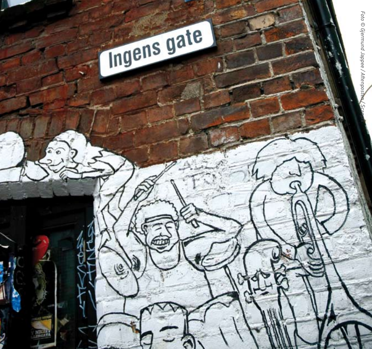
Ei navnløs gate ved Akerselva i Oslo, like ved utestedet Blå, har uoffisielt fått navnet Ingens gate. Offisielt er veistumpen en del av Brenneriveien.